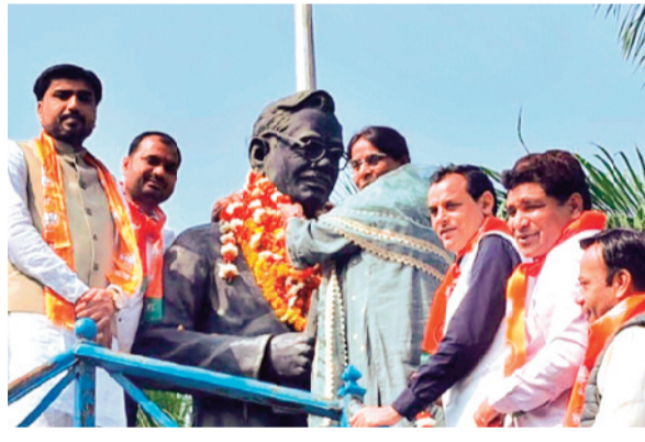
हरिभूमि न्यूज बीना