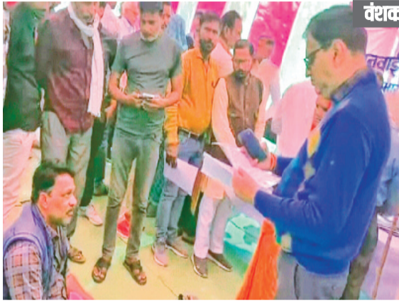
वंधाकर मोहल्ले की बहनों की पेयजल समस्या फरवरी के अंत तक हो रही समाप्त

कलेक्टर श्रोत्रिय ने बताया कि मोहनगढ़ जनसुनवाई विशेष शिविर के दौरान कुछ बहनों ने आकर शिकायत करते हुए बताया कि मोहनगढ़ के वंधाकर मोहल्ले में पेयजल की गंभीर समस्या व्याप्त है। क्योंकि वंधाकर मोहल्ले में पाइपलाइन नहीं है, जिसकी बजट से पेयजल की समस्या व्याप्त है। और साथ ही साथ मोहल्ले में चल रहा जलजीवन मिशन का कार्य भी पूर्ण नहीं कराया जा रहा। जिसको सुनने के बाद पीएचई विभाग के कार्यपालन यंत्रों को निर्देशित किया गया कि शीघ्र ही उक्त मोहल्ले में जलजीवन मिशन का कार्य पूर्ण कराया जाए।