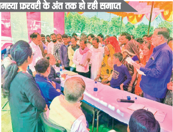
कार्ड, जाति सुधार व अभिलेख दुरुस्ती आवेदनों पर हुई कार्यवाही